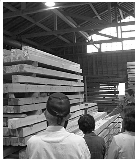
森と木とすまいツアー&セミナー (木材加工場にて)