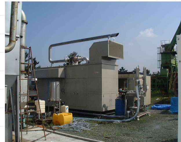
写真2 150kW DF発電パッケージ