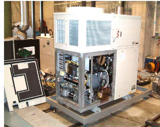
写真1 9.8kW DFコージェネシステム

ディーゼル機関の吸気系にガスミキサーを追加し、ガス流量、混合気流量に応じて液体燃料の噴射量制御を行い一定出力で運転する