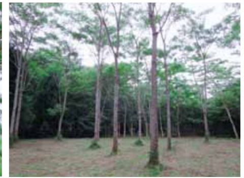
芽かきにより育成したセンダンの林分 (上益城郡甲佐町「舞の原試験展示園」)