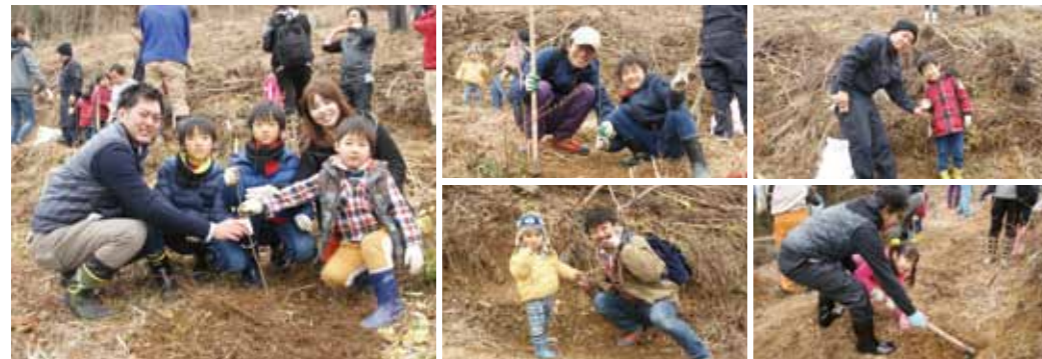
大川市の6家族が参加。