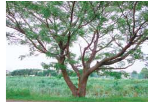
一般的なセンダンの樹形

早生樹は用材としてだけでなく、バイオマスエネルギーの熱源としても有望視されています。その中でも成長が早く比重が高い早生広葉樹は、その熱量も大きいものと思われれます。しかし、CO 2 固定の観点からすると、まず用材としての活用を優先し、用材として利用不可能な部位を熱エネルギーとして利用することが求められるのではないのでしょうか。