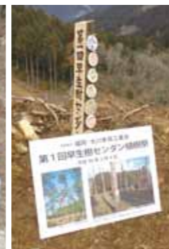
センダンで作った記念碑。