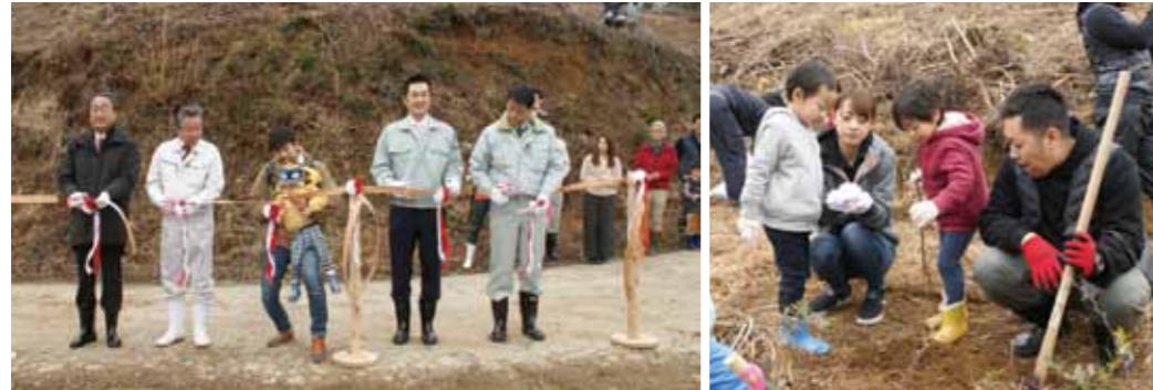
ウッドテープカットで植樹イベントがスタート。