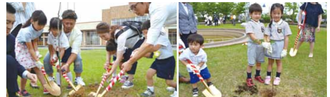
大川の白鷺幼稚園と風浪宮保育園に通う4家族が参加。

大川木材事業(協)、大川化粧合板工業(協)、大川建具事業(協)の皆さまとの共催で、大川市文化センター、大川中学校に合計20本のセンダンを植樹しました。