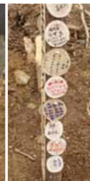
センダンの枝を輪切りにしたメッセージカード。

八女森林組合の皆さまのご協力のもと、八女市上陽町に500本のセンダンを植樹しました。