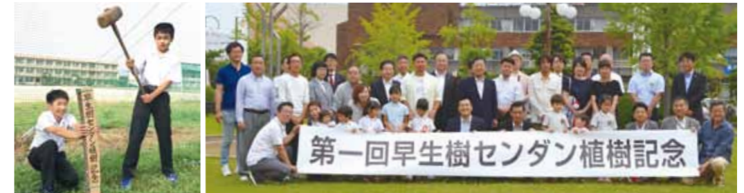
大川中学校の生徒会長と副会長。