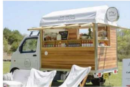
地域材モビリティ【森箱】のイメージ

軽トラの荷台に載せるだけで様々なシーンの拠点になる木製ユニットを開発する。「森」をキーワードにストーリー性を付加し、移動可能かつデザイン性の高い快適空間を実現。標準仕様と複数の用途別オプションパッケージを開発し、様々な事業者に対して活用を提案する