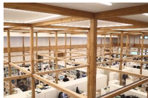
当麻町新庁舎 (コアドライ管柱・4寸角)