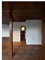
コアドライ天井材、羽目板等